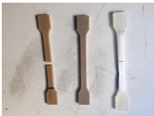
CNF 混合プラスチック試験片