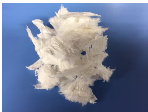
疎水化セルロース